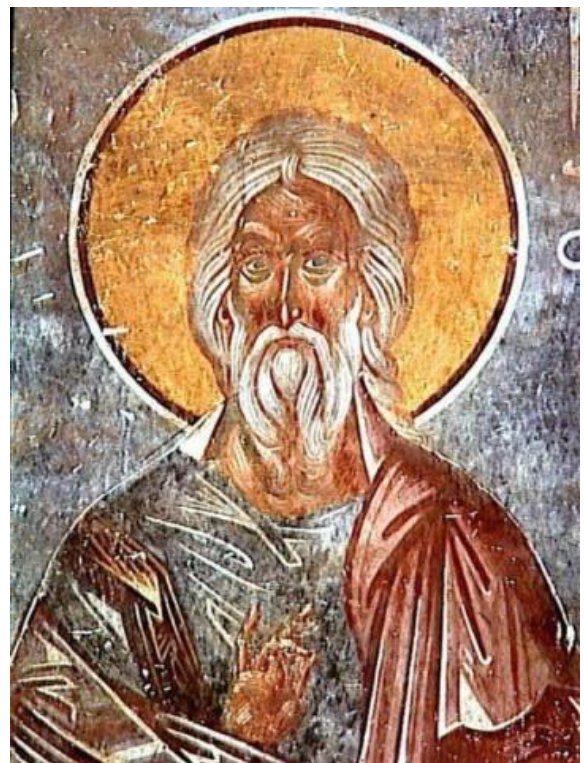
Le Prophète Jérémie.